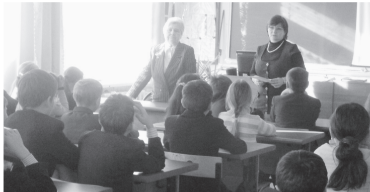
В СОШ №5 г. Новочебоксарска.

В школах г. Новочебоксарска проходит месячник военно-патриотического воспитания, приуроченный к 70-летию победы в Сталинградской битве.