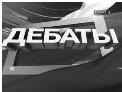
График дебатов на республиканских каналах

22 февраля. Зюганов – Прохоров 29 февраля. Зюганов – Жириновский