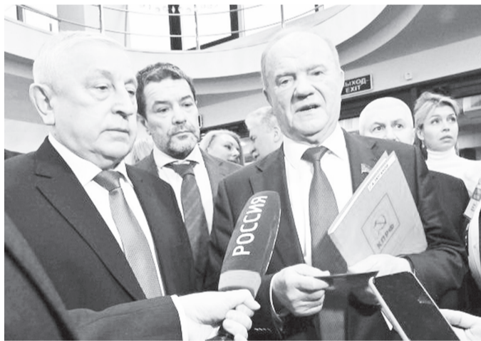
● Г.А. Зюганов и Н.М. Харитонов дают интервью журналистам.