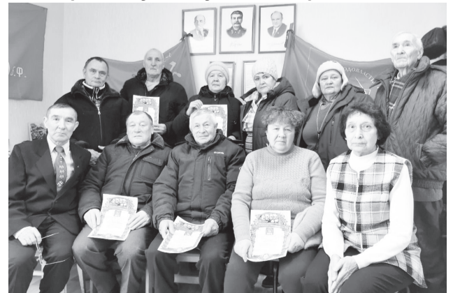
● Активисты ПО «Центральное».