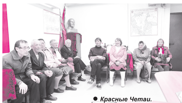
● Красные Четаи.