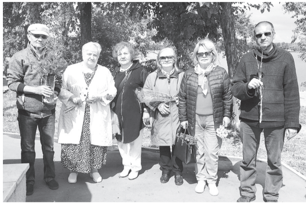
со дня начала Великой Отечественной войны.

В Козловке активисты КПРФ и городского совета ветеранов возложили цветы к памятнику землякам, отдавшим свою жизнь за свободу и независимость социалистической Родины. А в помещении местного отделения КПРФ состоялось заседание дискуссионного политического клуба «Товарищ», посвящённого 82-й годовщине