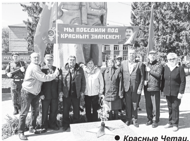
● Красные Четаи.