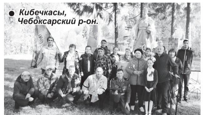
● Кибечкасы, Чебоксарский р-он.