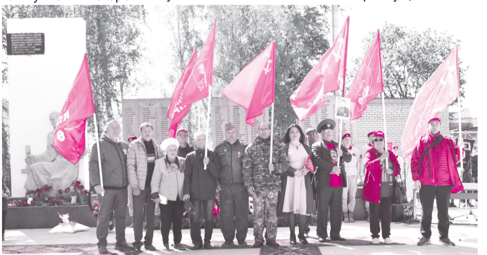
● Мариинский Посад.