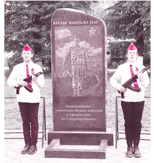
к памятнику погибшим при исполнении воинского долга.