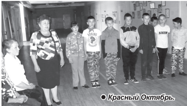
● Красный Октябрь.