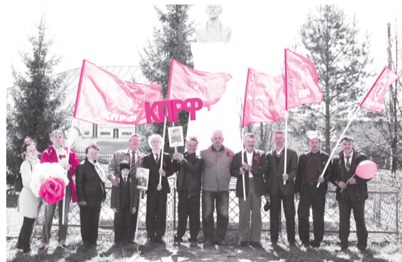
● Местные коммунисты привели в порядок памятник Ленину в детском парке города Мариинский Посад.

Служба в погранвойсках помогает мне преодолевать трудности. А выработанная выносливость способствует достижению успехов в спортивном ориентировании.