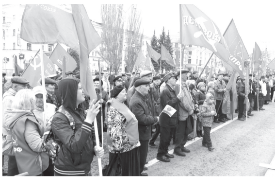
● Чебоксары. Площадь Республики.