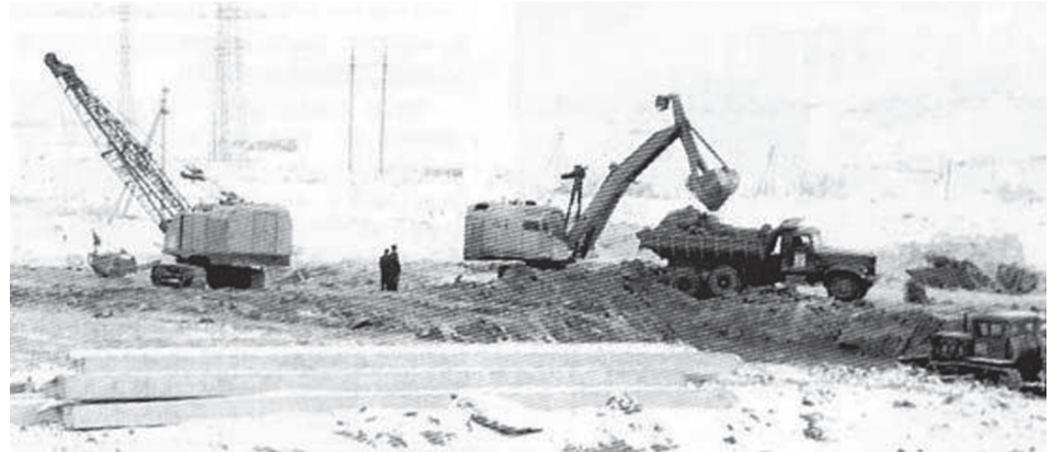
● Так начиналась стройка.