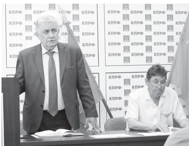
27 июня 2017 года состоялось заседание секретариата Чувашского рескома КПРФ. Его