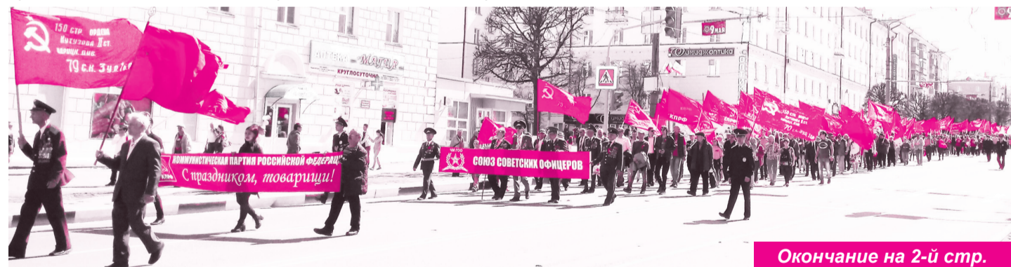
Окончание на 2-й стр.