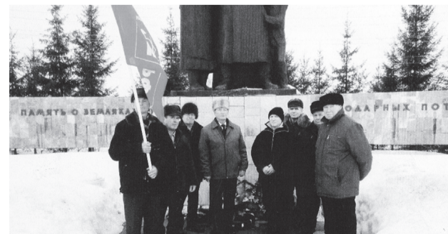
Проведя отчетную конференцию, коммунисты возложили цветы к памятнику землякам, погибшим в годы Великой Отечественной войны.