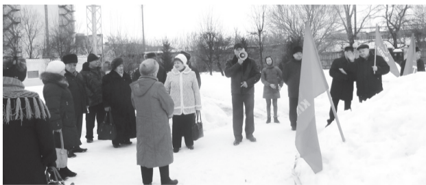
Алатырские коммунисты вместе со сторонниками КПРФ и неравнодушными гражданами провели протестный митинг в парке Ветеранов.