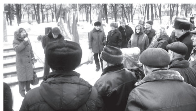
Коммунисты провели митинг в Канаше на площади перед городским Дворцом культуры, у стелы, посвященной воинам-вагоноремонтникам, погибшим во время Великой Отечественной войны.