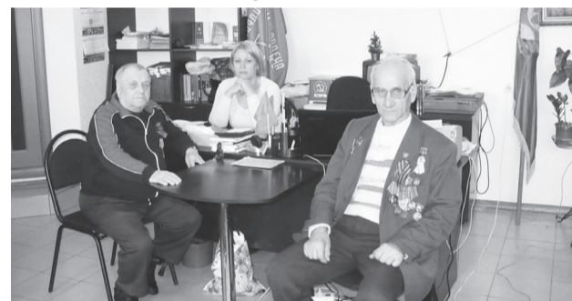
Коммунисты города организовали пикет и чествование ветеранов Советской Армии и Военно-Морского Флота.