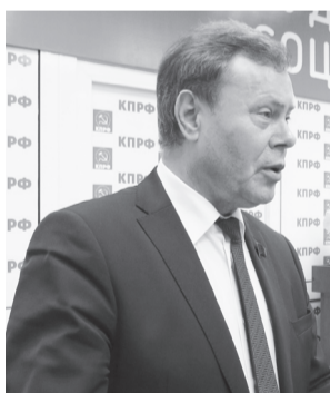
● На трибуне Н.В. Арефьев.

«Об экономической ситуации в стране и работа ЦК КПРФ и фракции КПРФ в Государственной Думе ФС РФ по защите прав и законных интересов ветеранов труда, пенсионеров и «детей войны». (Докл. секретарь ЦК КПРФ, депутат Государственной Думы ФС РФ, председатель Все-