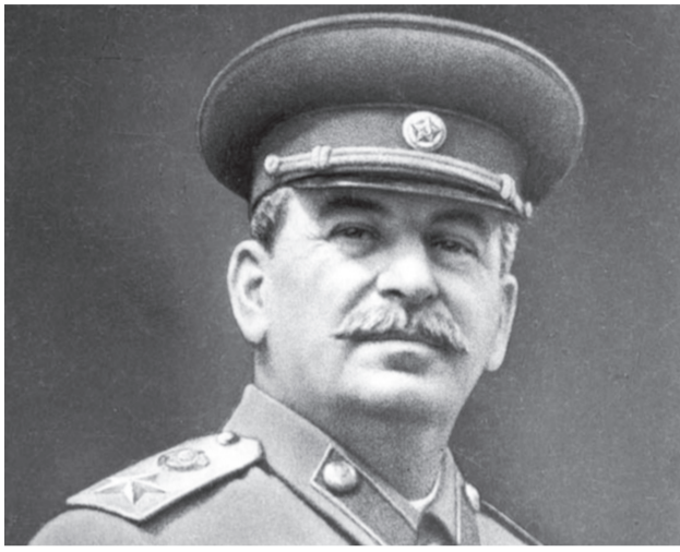
(Продолжение. Начало на 1-й стр.)

Попробуем разобраться, что же вызывает особую ярость злопыхателей.