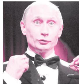
РФ, Ельцин, Путин