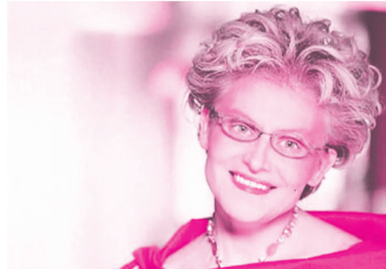
Е. Малышева, программа «Жить здорово», Россия