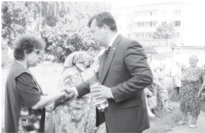
Активисты программы «Народный Ревизор» незамедлительно взялись за решение озвученных вопросов.

В заключение встречи жители поделились своими проблемами. Козловчан беспокоят плохие дороги, ужасное качество питьевой воды и отсутствие кружков для детей дошкольного возраста.