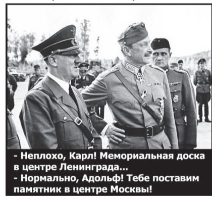
- Неплохо, Карл! Мемориальная доска в центре Ленинграда... - Нормально, Адольф! Тебе поставим памятник в центре Москвы!