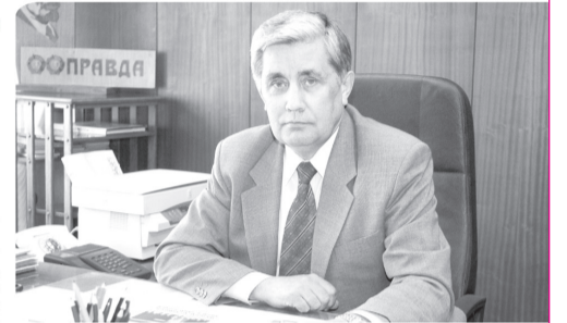
Депутат Государственной Думы Федерального Собрания Российской Федерации, первый секретарь Чувашского рескома КПРФ

Чувашский реском КПРФ сердечно поздравляет вас со знаменательным праздником – 96-ой годовщиной Чувашской Республики!