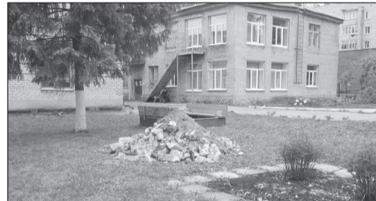
• Так стало...