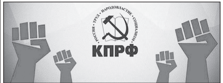
График мероприятий, проводимых в рамках Всероссийской акции протеста 3-6 февраля