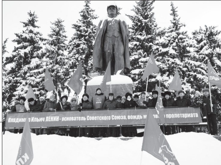
Победы и на улице Текстильщиков.

В Чебоксарах коммунисты и сторонники партии почтили память основателя Советского государства и Чувашской автономии на площади Республики, возложив корзину цветов к подножию памятника Ленину. Прозвучали выступления первого секретаря горкома КПРФ, руководителя партийной фракции в