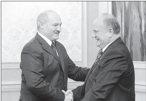
благо братской Беларуси.

От имени Центрального Комитета КПРФ, Совета СКП-КПСС, фракции КПРФ в Государственной Думе и всех коммунистов нашего Отечества поздравляю Вас с переизбранием. Желаю Вам новых трудовых побед и больших успехов на