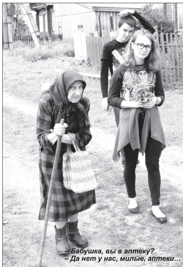
– Бабушка, вы в аптеку? – Да нет у нас, милые, аптеки...