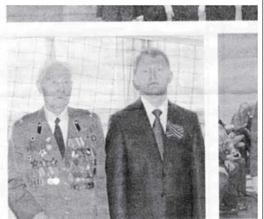
...пьяны и усраинных учеников Вячесла- слава В... ● То самое фото в газете «едросов».

лся кон- зпросы. дач с по- рез суд, (ставите- с домом в судеб- добиться дома. Со- юзволил щё трём токиты и ным ин-