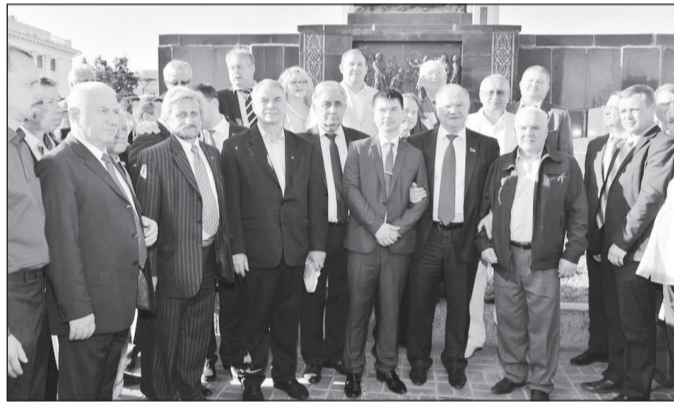
● Чувашская партийная делегация с Г.А. Зюгановым у памятника Ленину.

вов уже 250 миллиардов потрачено на то, чтобы погасить кризис, а результата по-прежнему нет. Лидер КПРФ выразил мнение, что главная беда последних 20-25 лет – в малограмотных и плохо подготовленных управленцах.