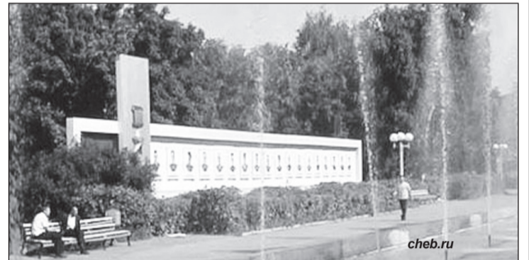
● Стела героев-чебоксарцев, стоявшая в сквере до 2008 года.