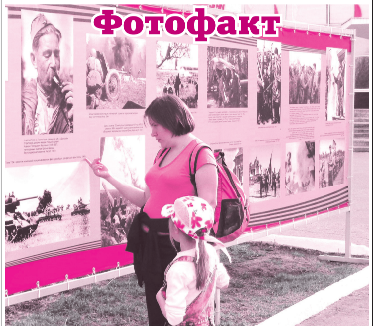
Урок чтения, урок истории, урок любви к Родине: молодая мама учит дочку читать возле стенда с фотографиями военных лет, посвящённого Дню Победы (г. Новочебоксарск).