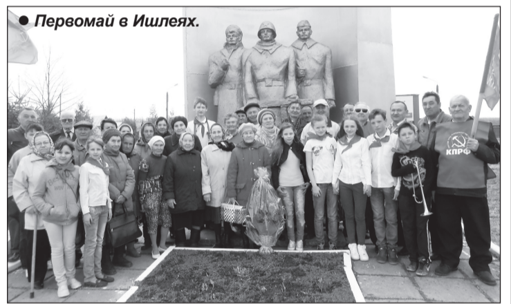
● Первомай в Ишлеях.