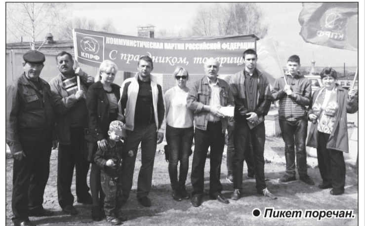
● Пикет поречан.

Пресс-служба Чувашского рескома КПРФ. Фото К. Сундырцева, Е. Матвеевой, И. Дмитриева, В. Иванова, В. Верендеевой.