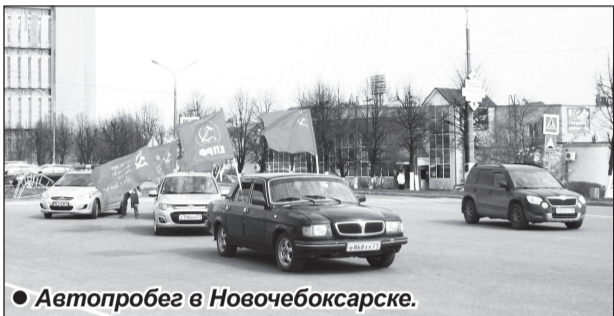
● Автопробег в Новочебоксарске.