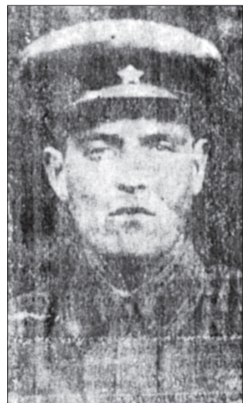
● Единственная сохранив- шаяся фотография моего прадедушки.

Чебоксары – Минск – Гродно – Чебоксары. Сентябрь 2013 г. – март 2015 г.