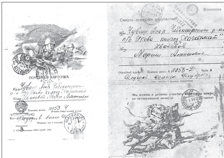
● Письма С.Ф. Фёдорова с фронта.

После прорыва блокады Ленинграда советские войска в начале 1944 года начали большое наступление. Особо отличившиеся части получили звание