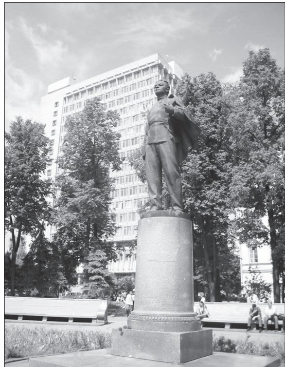
● Памятник студенту В. Ульянову (Ленину) перед главным корпусом Казанского университета.