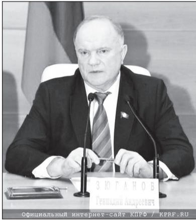
Официальный интернет-сайт КПРФ КРФ.РУ

«За прошлый год было продано нашего сырья, всех граждан страны, на 20 триллионов рублей. В бюджет попало 7,5 триллионов, остальные – это дань, которую платим и иностранной олигархии и своей. Это полное безобразие. Почему не хотят из этой огромной суммы хотя бы ещё 3-4 триллиона взять? Тогда бы решили