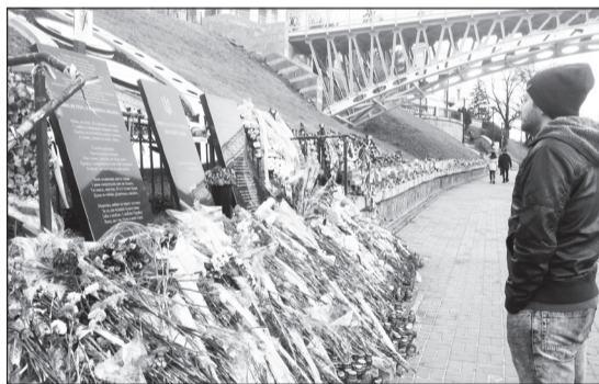
● Майдан Незалежности теперь превращён в мемориальный комплекс.

ления. Ещё там не любят Путина, конечно, пропаганда делает своё дело. В остальном, ничего необычного, всё спокойно, мало что напоминает прошлогодний переворот. Не считая лишь нескольких транспарантов с лозунгами и мемориальной атрибутики в честь погибших в прошлом году на Майдане. Сам Майдан теперь чистый и красивый, не тот, что был в 2014-м.