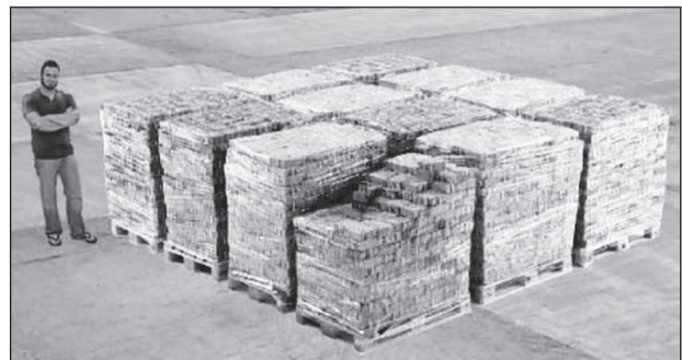
Вот так выглядит миллиард налом.

Факт № 2: У арестованного губернатора-единоросса Хорошавина нашли 1 миллиард наличных ( http://www.ntv.ru/novosti/1355658 ).