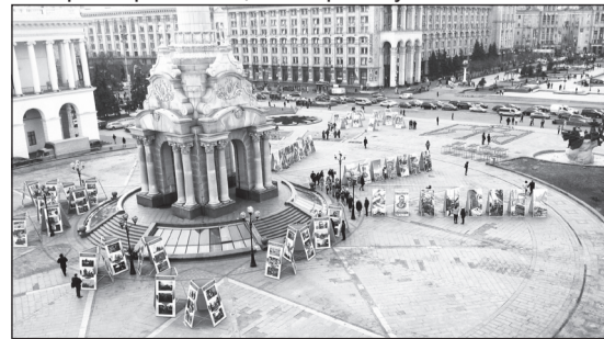
● Стенды в честь так называемой «небесной сотни».

– Так ли враждебно настроено украинское общество против нашей страны, как это показывают официальные российские СМИ?