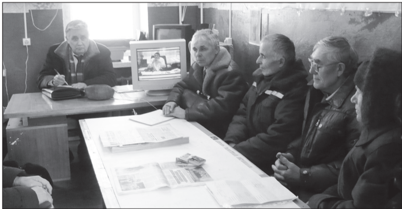
● В Вурнарском райкоме КПРФ.

Почти вся прошлая неделя прошла у депутата Государственной Думы Российской Федерации Валентина Сергеевича Шурчанова в рабочих поездках по республике. В прошлом номере «Чебоксарская правда» сообщала о встречах депутата-коммуниста с чебоксарскими и канашскими избирателями.