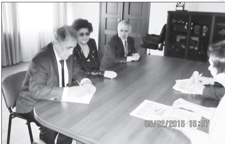
● В администрации г. Алатырь.

Позже состоялись встречи с руководством и педагогами Вурнарского сельхозтехникума.