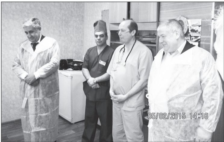
● В Алатырской ЦРБ.