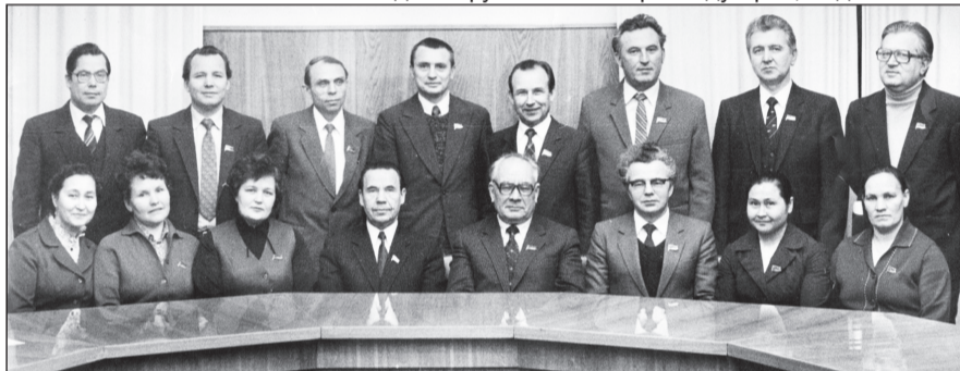
● Президиум Верховного Совета Чувашской АССР десятого созыва (1980-1985 гг.)

квалифицированные кадры строителей и монтажников. Это стройтресты №№ 1 и 5, «Сантехмонтаж», «Волгоэлектромонтаж», «Нефтехиммонтаж», «Стальконструкция», построенные заводы железобетонных изделий, керамблоков, силикатного кирпича, домостроительный комбинат и др.