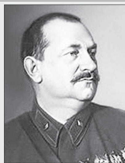
Владимир СТАВСКИЙ — один из организаторов 1-го съезда советских писателей. С 1936-го, после смерти М. Горького, — генеральный секретарь СП СССР. В 1937–1941 — главный редактор журнала «Новый мир». Во время Великой Отечественной войны — военный корреспондент, автор очерков, рассказов, пьесы «Война» (1941). Погиб на фронте 14 ноября 1943-го у д. Турки-Перевоз в р-не г. Невеля.