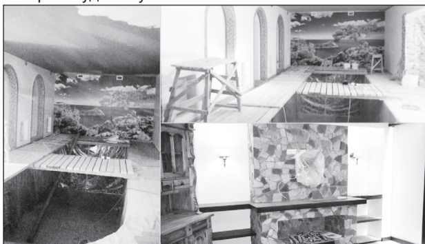
● Строящийся банный комплекс в Доме правительства.