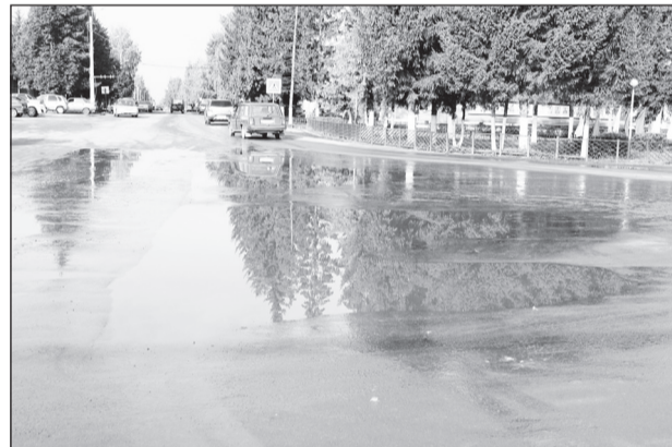
● Так выглядит подъезд к селу Красные Четаи после дождя.