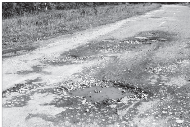
● Участок дороги «Лоба – Испуханы – Кумаркино», оставшийся без ремонта.

Кроме того, всплыл ещё один любопытный факт. Данный участок автодороги в бытность своей работы в