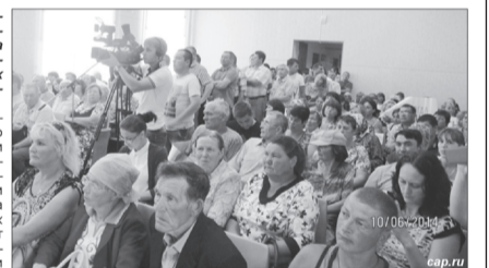
Лишь о строительстве «мусороперегрузочной станции для приёма ТБО» а не полигон ТБО.

Давалась там, прежде всего, оценка воздействия на окружающую среду будущего крупного полигона ТБО с мусоросортировочным участком на территории Тобурдановского сельского поселения. Обслуживать этот полигон в будущем должен три муниципалитета: г. Канаш, Канашский и Комсомольский районы. Неудивительно, что на обсуждениях прибыли сотни жители населённых пунктов обоих районов и города. Однако формат обсуждений из внутривоспользовательского неожиданно стал межрегиональным – на них прибыли представители соседнего Татарстана в лице заместителя Канашской районной администрации, а также чиновника Минприроды РФ. Их интерес понятен – будь ли политический или экономический интерес.