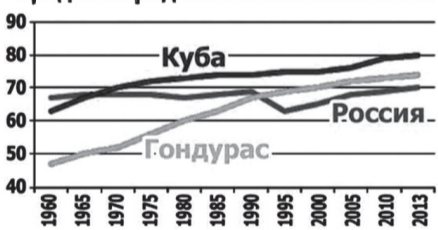
Средняя продолжительность жизни

Нам же хотелось, чтобы такой график (см. внизу) и вывод был бы размещён в наших школьных учебниках истории, в параграфах, где речь идёт о реставрации капитализма в России, чтобы люди знали, какой ценой нам она обошлась.