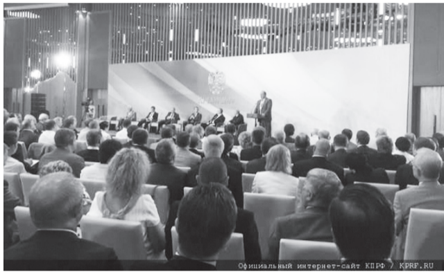
Официальный интернет-сайт КПРФ, KPRF.RU

«Донбасс, — продолжил лидер КПРФ, — это урок того, что может творить полуфашистская, нацистско-бандеровская власть со своими собственными гражданами, если ей попустительствовать. Поэтому мы должны продумать целый ряд мер, чтобы остановить это крайне опасное нашествие». Г.А. Зюганов подчеркнул, что действия украинских властей представляют угрозу как для Крыма, так и для Российской Федерации в целом.