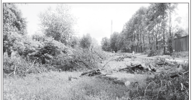
● Насаждения, которые жильцам удалось отстоять.