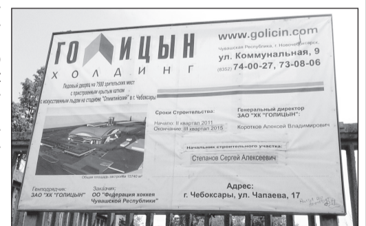
Фото автора. ● На плане данных о парковке нет.