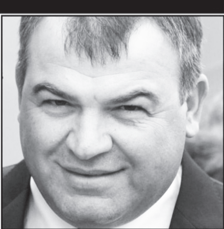
ЧО СМОТРИТЕ ? НЕ ДОЖДЕТСЯ

Своё мнение депутат-коммунист высказал в ходатайстве, которое сразу после получения ответа из ГВП направил президенту России Владимиру Путину.