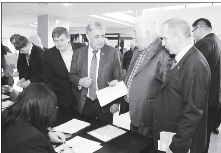
● В кулуарах пленума.