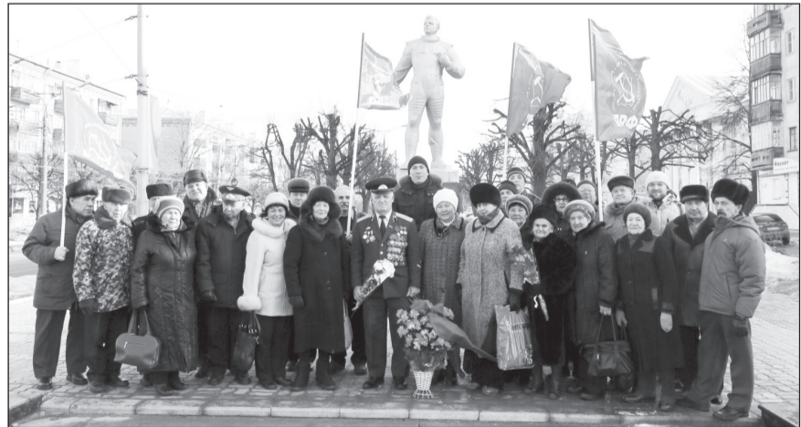
● Живые цветы от чебоксарских коммунистов...

Из всех политических сил города только чебоксарские коммунисты и комсомольцы достойно отметили памятную дату, возложив к памятнику Ю.А. Гагарину настоящие, а не виртуальные цветы.